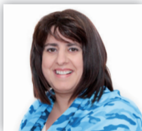
Gamma Alexandra Souffleuse